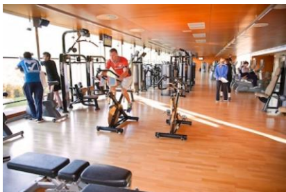
Landako II-ko Fitness aretoa