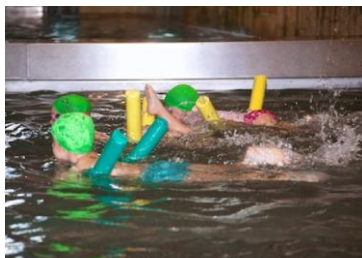
Umeak Landako II-ko igerilekuan