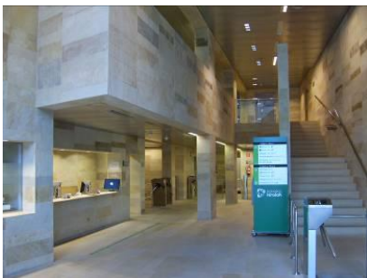
Landako II polikiroldegiko harrera