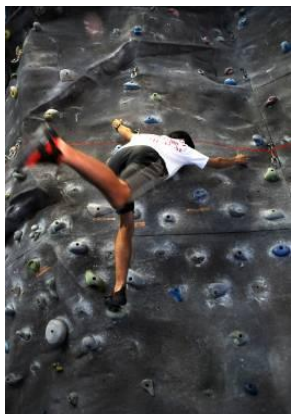
Landako I-eko Rokodromoa