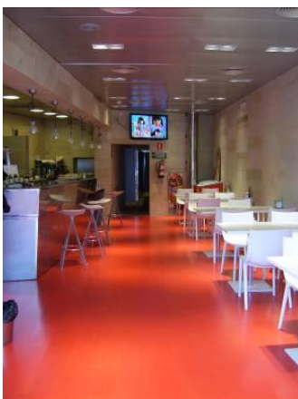
Landako II-ko Kafetegia