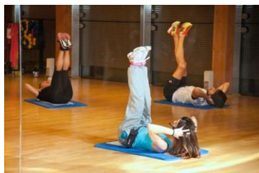
Pertsonak kirola egiten

Durango Kirolak eskaintzen dituen zerbitzuen hobekuntza arloan parte hartu nahi duenak honako bide hauek erabil ditzake: