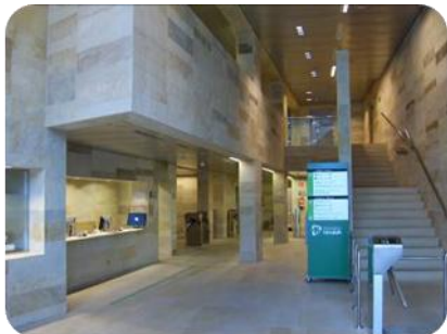
Landako II polikiroldegiko harrera