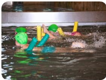
Umeak Landako II-ko igerilekuan