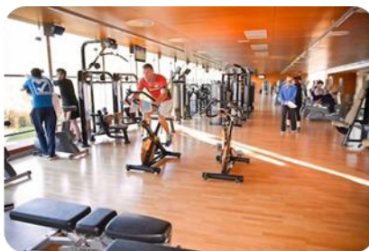
Landako II-ko Fitness aretoa