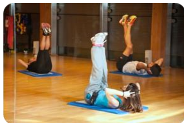
Pertsonak kirola egiten

Durango Kirolak eskaintzen dituen zerbitzuen hobekuntza arloan parte hartu nahi duenak honako bide hauek erabil ditzake: