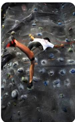
Landako I-eko Rokodromoa